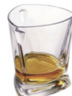
モンキーショルダー ロックグラス