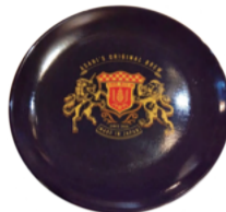
アサヒザリッチ皿