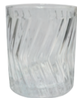
グランツ ロックグラス