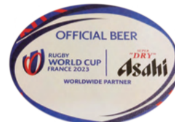
ラグビー コースター